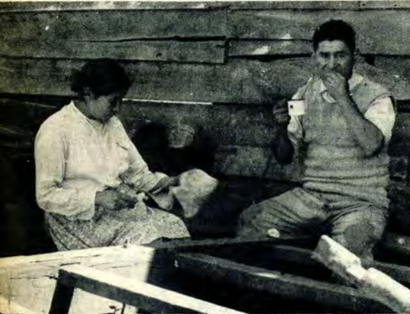
"Para el inquilino, la hacienda es su patria. Muchos ignoran hasta el nombre de la provincia donde residen." (Cronista anónimo, en 1861.)